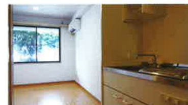
使いやすいスタジオタイプの間取り。