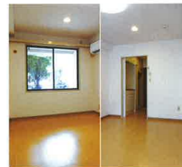
白基調の明るい室内です。