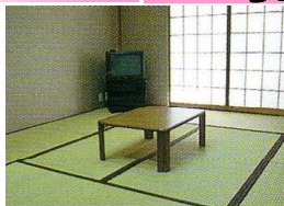
本館 和室 10畳 定員5名