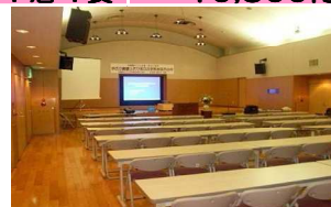
大ホール1室 最大150名 225㎡