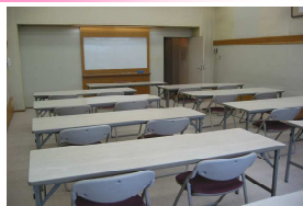
研修室3室 30名 44.5㎡