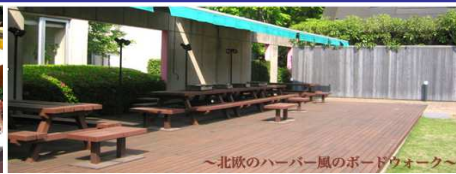
～北欧のハーバー風のボードウォーク～