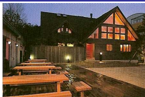
宿泊定員9名 会議スペース 占有風呂 有