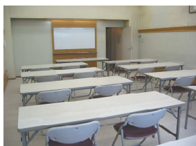
研修室3室 30名 44.5㎡