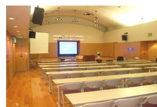
大ホール1室 最大150名 225㎡