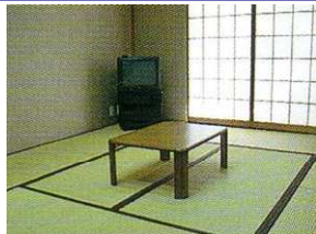
本館 和室 10畳 定員5名