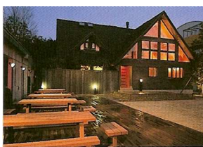
宿泊定員9名 会議スペース 貸切風呂