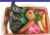
もりもりランチ420円