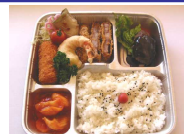
わんぱくランチ750円