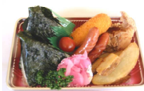
わくわくランチ525円