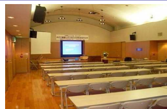
大ホール1室 最大150名 225㎡