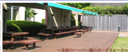
～北欧のハーバー風のボードウォーク～