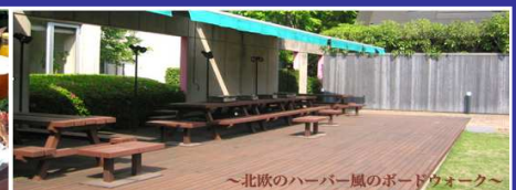
～北欧のハーバー風のボードウォーク～