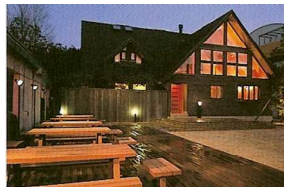
宿定員9名 会議スペース 貸切風呂