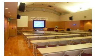
大ホール1室 最大150名 225㎡