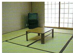
本館 和室 10畳 定員5名